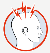
Sehr starker Kopfschmerz

Beim Auftreten von Schlaganfall-Symptomen wähle sofort: Notruf 112