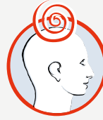
Schwindel mit Gangunsicherheit